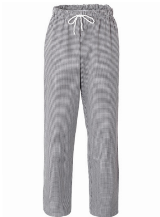
Q32 - Quadro nero